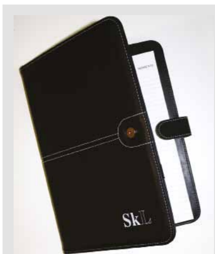
SkLs dokumentmappe, kr 150,-