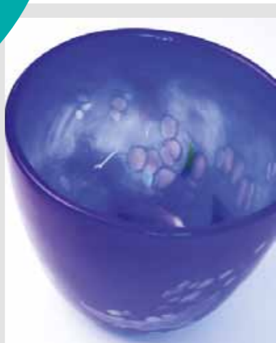
Liten bolle fra SkL, kr 250,-