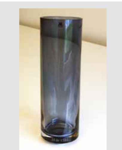
Høy SkL-vase, kr 350,- 25-års jubileumsvase, kr 250,-