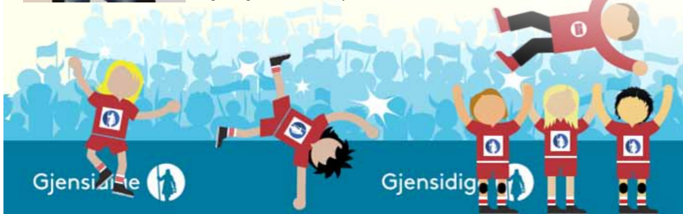
- Veldig gøy, melder en fornøyd vinner, særlig da Norge vant gullet i EM i håndball for kvinner 2016.