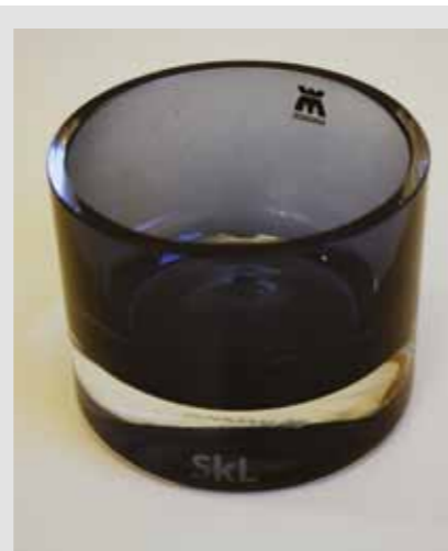
SkL lyslykt, kr 165,-