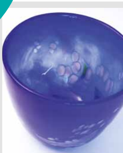
Liten bolle fra SkL kr 250,-