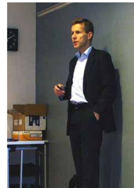
Amund Noss, ekspedisjonssjef i Finansdepartementet la vekt på det langsiktige perspektivet i arbeidet med å legge om skatte- og avgiftsforvaltningen.

- Det er befriende å høre at Finans er så tydelige på at de ønsker å måle oss på