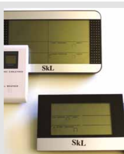
Stor værstasjon kr 200,- Liten værstasjon kr 180,-