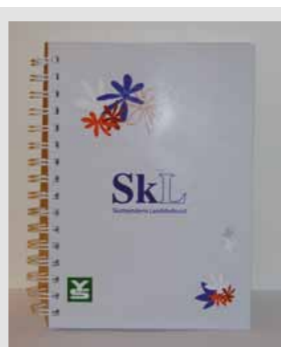
A5 skrivebok kr 30,-