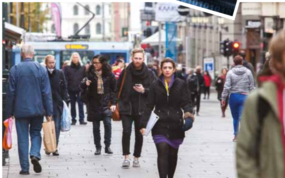
Nordmenn opplever fortsatt arbeidslivet som godt.

Arbeidsvilkårene når det gjelder stress og mestring er noe bedre sammenlignet med tidligere år. Det henger sammen med at færre har fysisk hardt eller risikofylt arbeid. Samtidig øker tidspresset. Noen flere enn før opplever arbeidet som stressende.