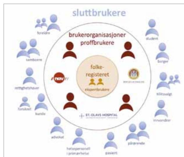
Et korrekt og oppdatert folkeregister har bidratt til store effektiviseringsgevinster for hele det norske samfunnet i takt med utviklingen av IKT og elektronisk kommunikasjon. Ill.: Skatteetaten

Den kostnadsmessige vurderingen av de ulike alternativene har vært avgjørende for den endelige anbefalingen fra Skatteetaten. Beregninger som har blitt gjort, viser at de fire hovedalternativene vil kunne koste fra nærmere 2,5 milliarder kroner til rundt 25 milliarder kroner. Det er i hovedsak offentlig og privat sektor som vil bli påført den største kostnaden ved en innføring av ny personidentifikator. Spesielt kommunene, NAV, helsesektoren og banknæringen vil bli sterkt berørt av endringene. Det har derfor vært viktig å ta hensyn til