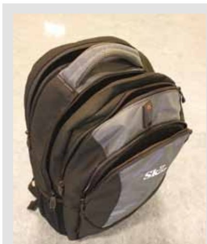
SkLs pc-sekk, kr 350,-