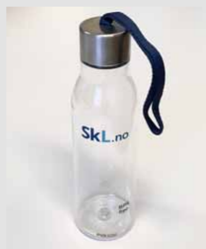
SkL drikkeflaske, kr 160,-