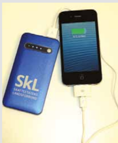
Lader med SkL-logo, kr 165,-