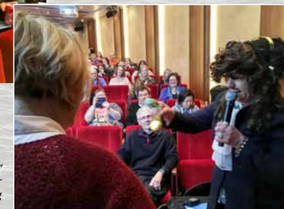
Kjeia tok villig imot gullpengene av "Kaptein Sabeltann" mot å avstå fra en bit av Nye Skatt. Vi foreslår at sjørøver'n får ansvar for boksen Innkreving.