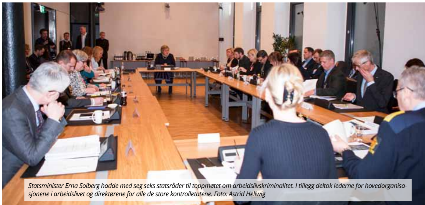
Statsminister Erna Solberg hadde med seg seks statsråder til toppmøtet om arbeidslivskriminalitet. I tillegg deltok lederne for hovedorganisasjonene i arbeidslivet og direktørene for alle de store kontrolletatene.