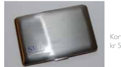
Kortholder kr 55,-