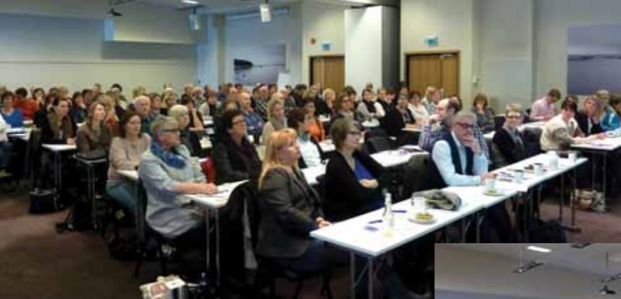
Det var stor deltakelse på SkL sørs konferanse på Kragerø Resort, med over hundre medlemmer og gjester. Stedet er kjent for sitt gode spa-tilbud og forsamlingen kommer her i stemning med en liten forsmak fra spa-ansvarlige på hotellet.