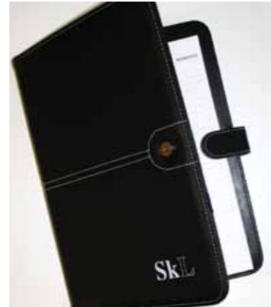
SKLs dokumentmappe, kr 150,-