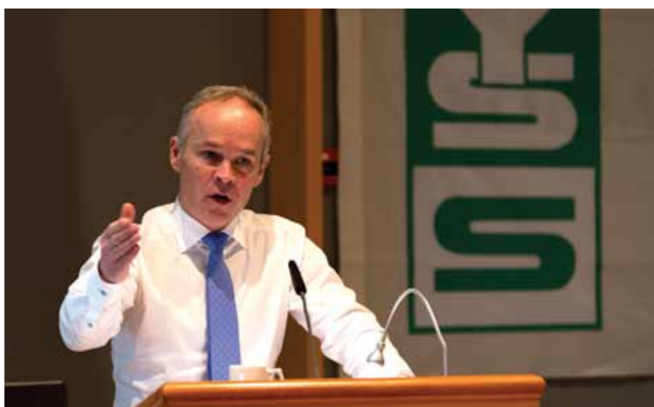
Høyres statsråd Jan Tore Sanner ønsker samarbeid med organisasjonene velkommen.

- Vi må sikre gjennomføringskraft, effektivitet og en innovativ forvaltning. Det gjør det offentlige bedre i stand til å møte endringene som kommer, understreket han.