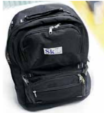
SKLs ryggsekk, kr 150,-