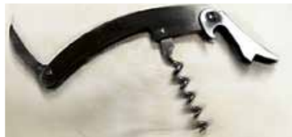
SKLs vinopptrekker, kr: 65,-