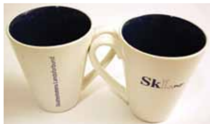
SKL-krus, kr 30,- per stk.