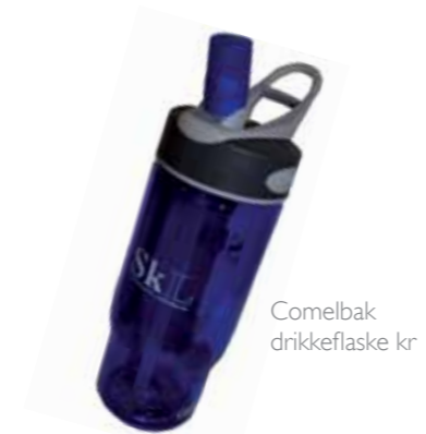
Comelbak drikkeflaske kr 125,-