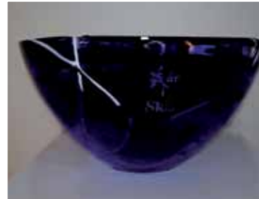
SKLs jubileumsbolle, kr 175,-