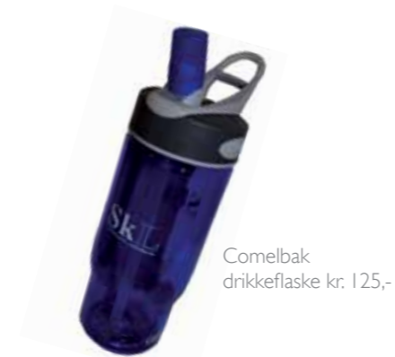
Comelbak drikkeflaske kr. 125,-