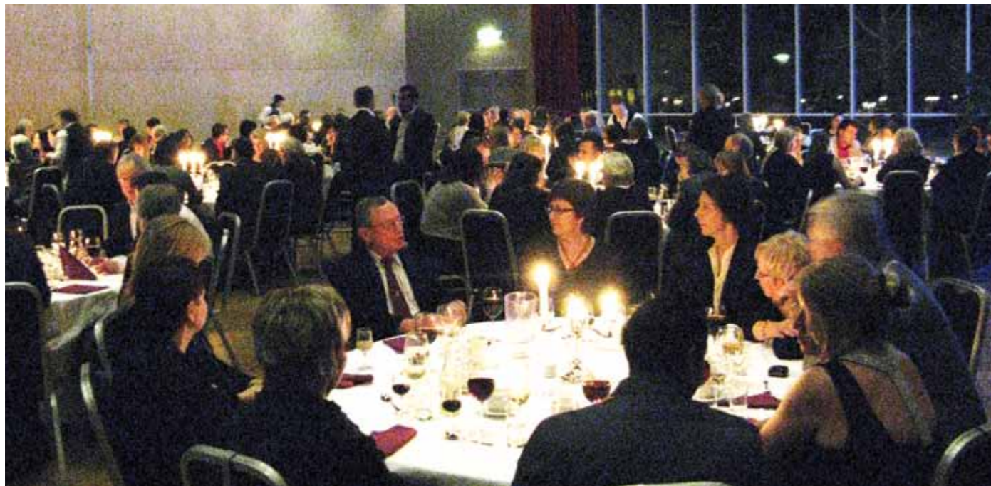
Hyggelig festaften i Charlottenberg.