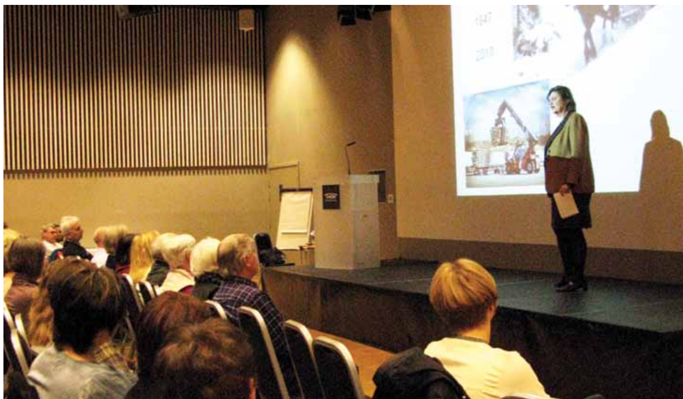
I 1947 var skogsarbeideryrket et av de vanligste yrkene i Norge, i dag er det bare rundt tusen igjen. Den teknologiske utviklingen har ført til at kjønnsroller også er i ferd med å endre seg. IQ har blitt viktigere enn styrke, og kvinner kan utføre yrket like godt som menn.