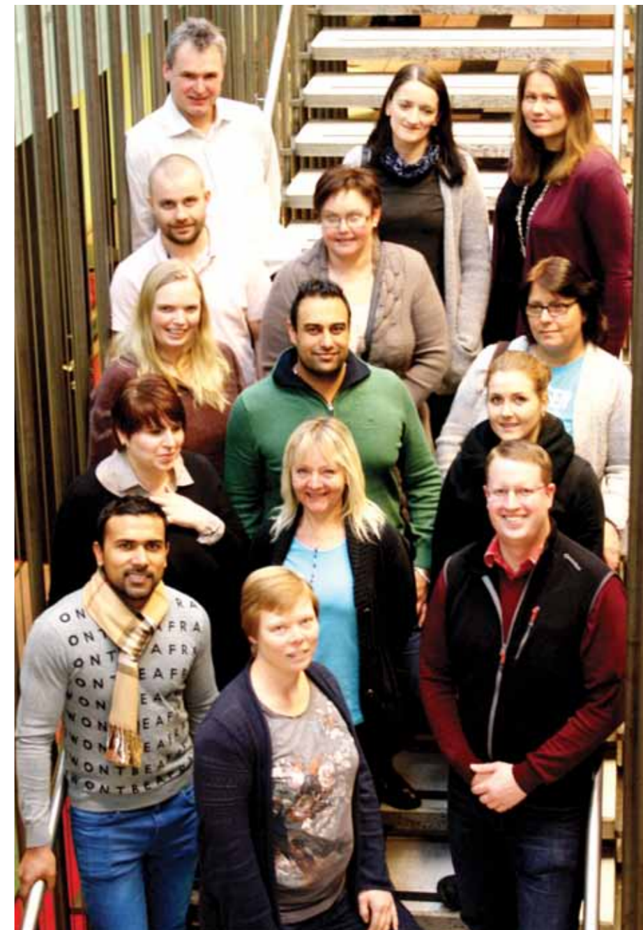
Deltakere og forelesere på trinn 1.

Det ble en gjennomgang og innføring i Hovedavtalen, inkludert tilpasningsavtalen for Skatteetaten. Vi fikk så anledning til å teste ut det teoretiske fra Hovedavtalen og til dels også Hovedtariffavtalen i forbindelse med to praktiske øvelser, kalt Case 1 og 2. Vi ble delt inn i grupper, hvor den ene gruppen representerte arbeidsgiver og de tre andre var forskjellige organisasjoner. Her skulle vi prøve ut forhandlinger og forhandlingsteknikk og taktikk, og vi fikk se hvordan slike situasjoner kan foregå i praksis. Spesielt ble det lagt vekt på at det er tre nivåer i Hovedavtalen som er viktig i forbindelse med møter, det at det blir delt inn i informasjonssaker, drøftingssaker og forhandlingssaker hvor det er forskjell på om det skal foreligge notat, referat eller protokoll i etterkant. Vi ble også minnet om at alle er likeverdige parter i forhandlingsmøter.