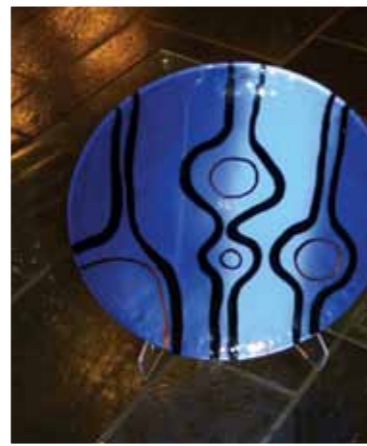
SKLs fat, kr. 500,-