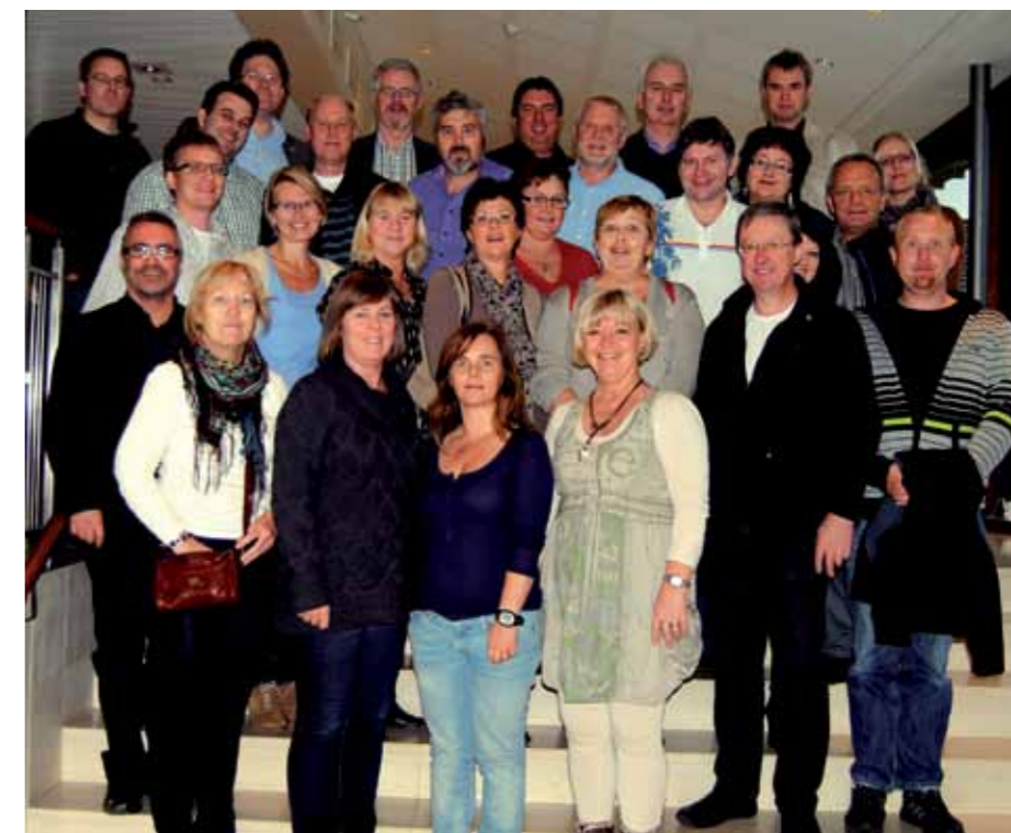
Landsstyremøtet 2012.

Generelt var det gode diskusjoner og gode innspill til de ovennevnte temaene. Vik-