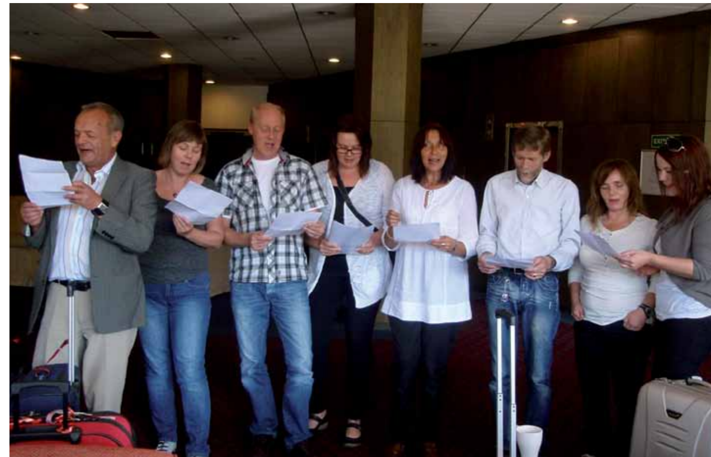
Fornøyde deltakere på Trinn 3.