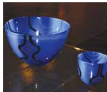
SkLs bolle, kr: 475,- SkLs lyslykt, 180,-