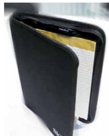
SkLs dokumentmappe, kr: 150,-