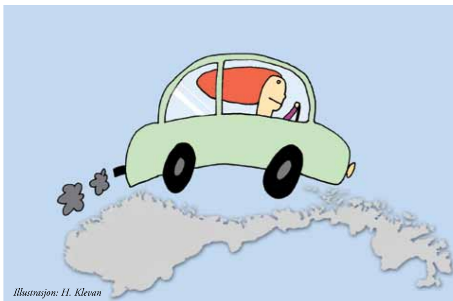
Illustrasjon: H. Klevan

Det er to av alternativene til de som er berørt av småkontorprosjektet. Aller helst håper vi det finnes gode løsninger for alle, men det vil den videre prosessen avklare. Utgangspunktet er i hvertfall at etaten ønsker at alle skal være med videre.