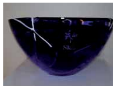
SkLs jubileumsbolle, kr: 175,-