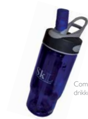
Comelbak drikkeflaske kr: 125,-