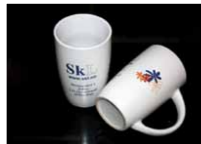
SkLs krus, kr: 25,-