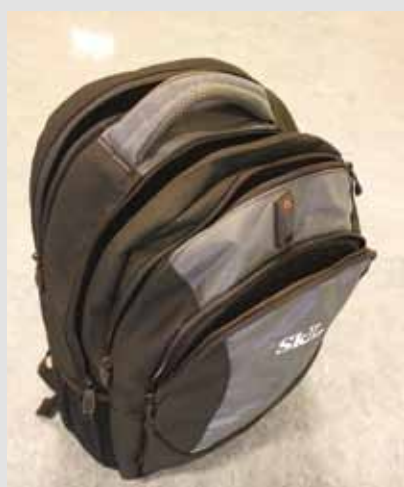
SkLs pc-sekk, kr 350,-