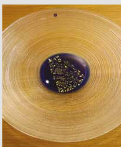
SkLs fat, kr 500,-