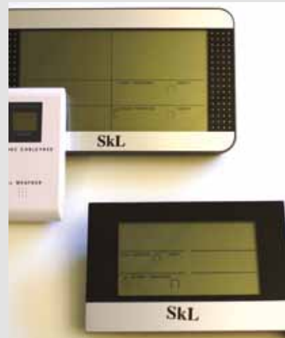
Stor værstasjon kr 200,- Liten værstasjon kr 180,-