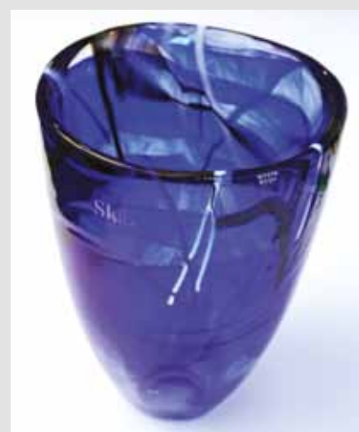
SkL-vase fra 365,-