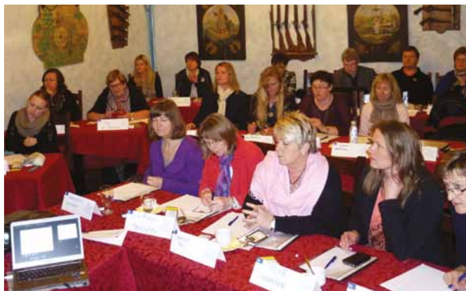
Bevisstgjøring av tillitsvalgtrollen både i forhold til medlemmer og arbeidsplassen, er et viktig element i kurset tillitsvalgtarbeid i praksis.

Det er mange elementer i en slik opplæring. Hvordan møter vi medlemmene? Hvilket førsteinntrykk får et potensielt medlem av den tillitsvalgte og av SkL? Har vi et fast håndtrykk og blikk-kontakt med dem vi hilser på? Førsteintrykket skapes i løpet av et par sekunder, her er det ikke rom for feil. Videre skal man mestre kunsten å overbevise. Vi skal fremstå tillits-