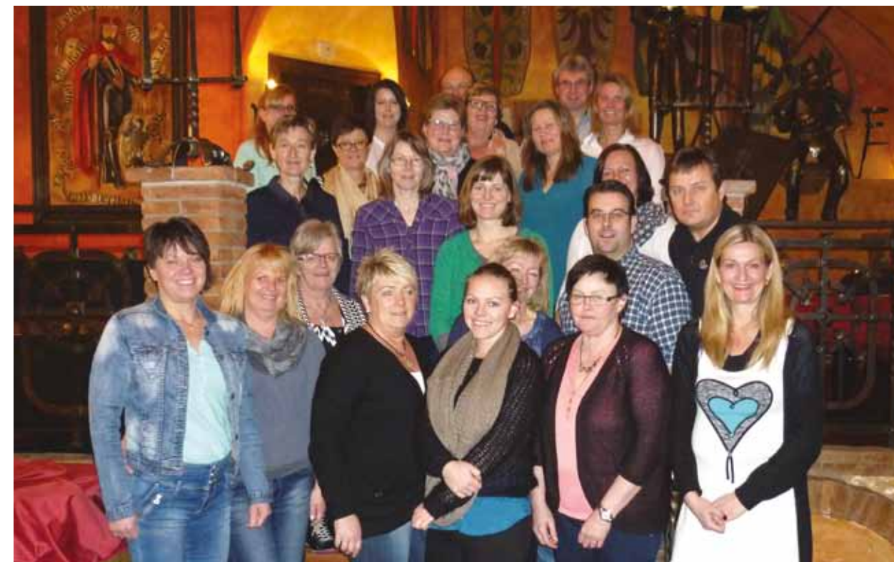
Styret og tillitsvalgte i SkL sør og tre fra SKD/SITS var samlet for tillitsvalgtopplæring i Praha. Her er hele gjengen samlet sammen med kursledere og representanter fra SkL sentralt.

SkL Ung-medlem med på turen, men informasjonen var svært nyttig for alle tillitsvalgte og styret i arbeidet med å verve nye medlemmer. Vi ble også tatt med inn i etatens etikk. Det forventes at våre tillitsvalgte følger etatens etiske retningslinjer. Dette er en viktig forventning til våre tillitsvalgte. Vi skal gå foran som gode eksempler for våre kollegaer, og oppfordre alle til å lese og følge de etiske retningslinjene etaten står for. I løpet av kurset fikk vi flere gruppeoppgaver hvor vi både ble vervet og måtte verve nye medlemmer. Hva er viktig å formidle til nye potensielle medlemmer?