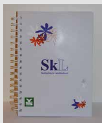
A5 skrivebok kr 30,-