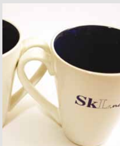
SkL-krus, kr 30,- pr.stk.