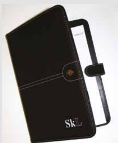
SkLs dokumentmappe, kr 150,-