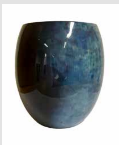
Stelton-vase, kr 899,-