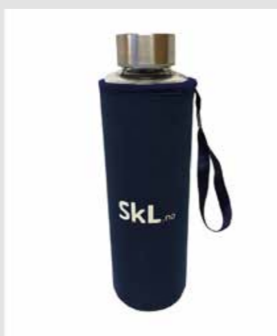
SkL drikkeflaske, kr 160,-