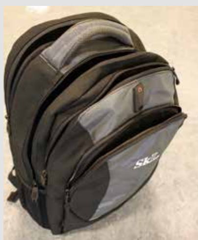
SkLs pc-sekk, kr 350,- Midlertidig utsolgt