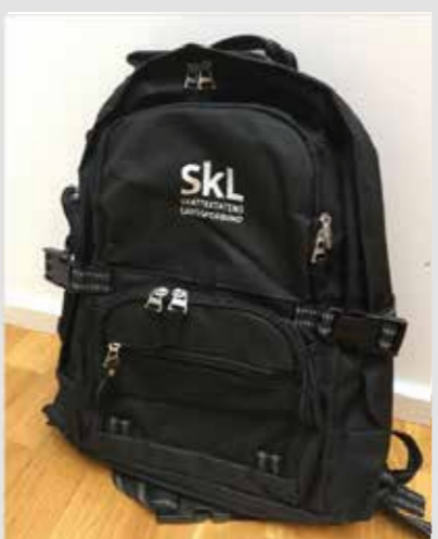
SkLs sekk, liten, kr 150,-