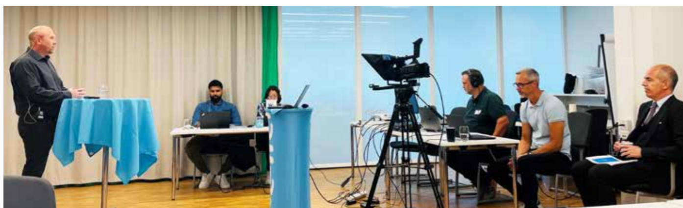
Kompetanseseksjonen er også primærleverandør for webinarer i Delta, her fra SkLs symposium i fjor.

samlinger og treffpunkter for tillitsvalgte både fysisk og digitalt. Vi får komme tilbake til hvilke kurs og samlinger SkLs medlemmer og tillitsvalgte kan delta på.