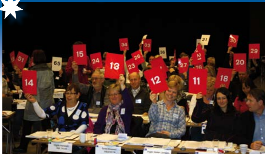
Fra landsmøtesalen, det stemmes.