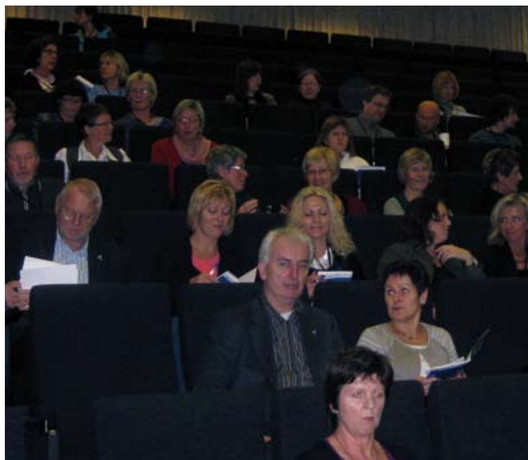
Fra medlemsmøte i Stavanger..

I vest har SkL i løpet av november arrangert medlemsmøter både i Bergen og Stavanger.