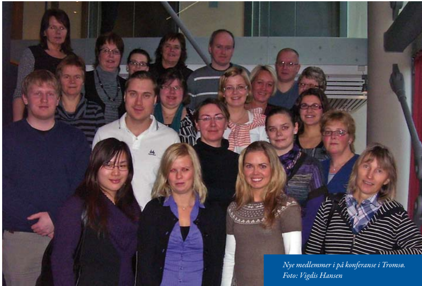
Nye medlemmer i på konferanse i Tromsø.

Torsdag 5. november møttes 30 SkL-medlemmer på SAS-hotellet i Tromsø. Blant disse 30 var vi 22 nye og spente medlemmer, og målet med de to dagene var å gi oss nye en orientering om viktige saker som rører seg innenfor fagforeningen.