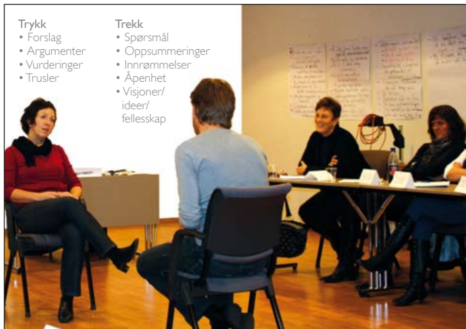
Her fra rollespill i "Trykk og Trekk" metoden.

Videre lærte vi at vi må skille mellom observasjon og tolkning. En observasjon er fakta som du ser, hører, kjenner,