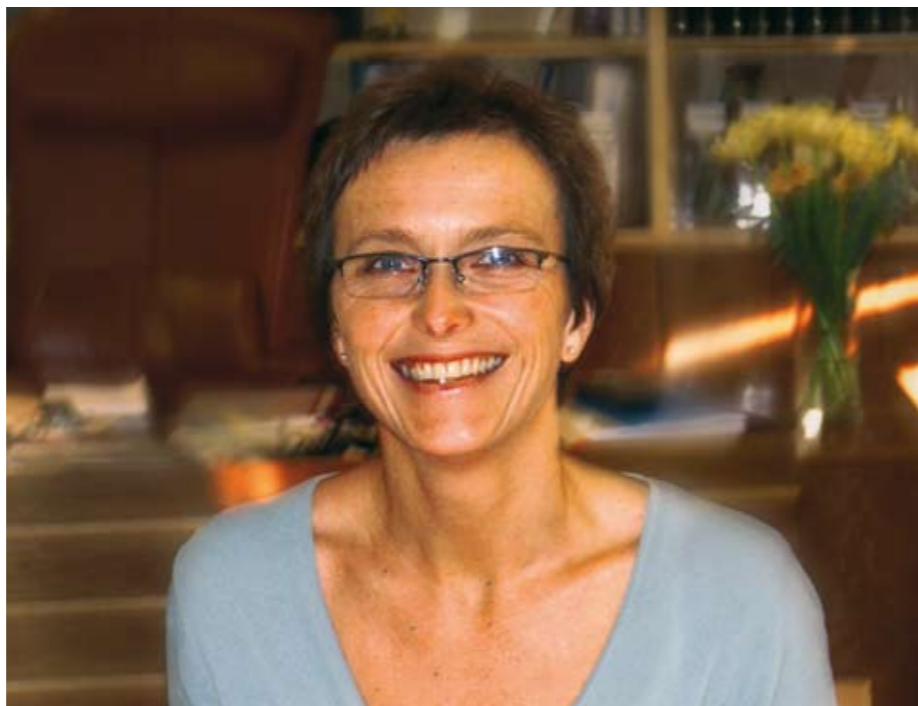
Fornyingsminister Heidi Grande Røys

En av de store utfordringene staten har er kampen mot korrupsjon. Dette er et økende problem som krever et våkent øye både fra leder og medarbeidersiden. Det må innarbeides gode kontrollrutiner, etiske retningslinjer som skal være med på å bygge en god kultur, regler for karantene samt gode retningslinjer for varsling. Det må bygges en kultur på å varsle når urovekkende forhold