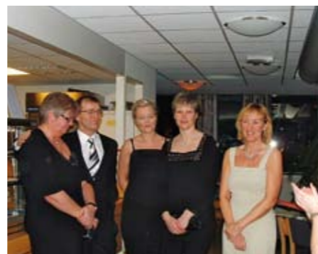
Velferdskomiteen på SOL i Bodø inviterte til åpningsseremoni.

moni på fredag kveld. Som seg hør og bør var det tale og snorklipp av avdelingsdirektør på SOL nord, Therese Hoseth Blomsø. Etterpå ble det servert tapas med følge. Stemningen var det