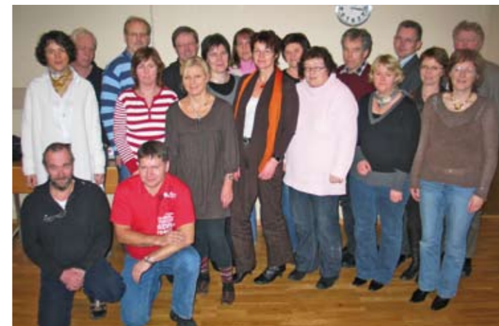
SkL Møre- og Romsdal