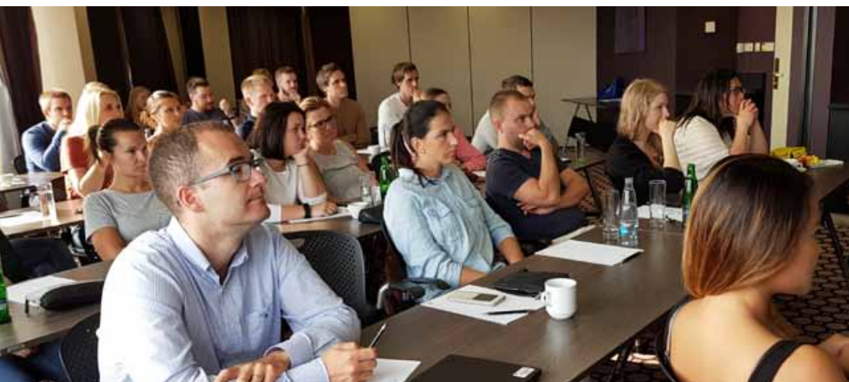
Spente og lydhøre SKL Ung-deltakere på årskonferansen.