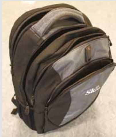
SkLs pc-sekk, kr 350,-