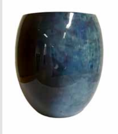
Stelton-vase, kr 899,-