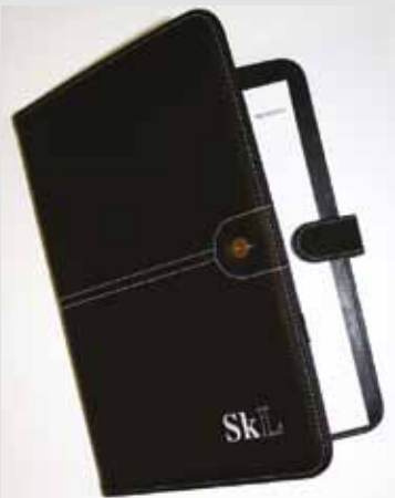
SkLs dokumentmappe, kr 150,-