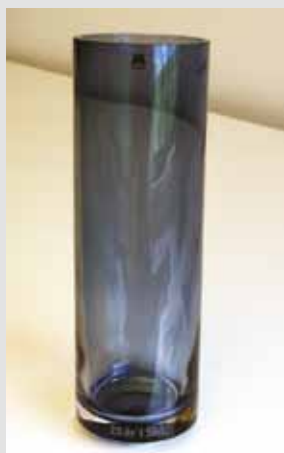
Høy SkL-vase, kr 350,-