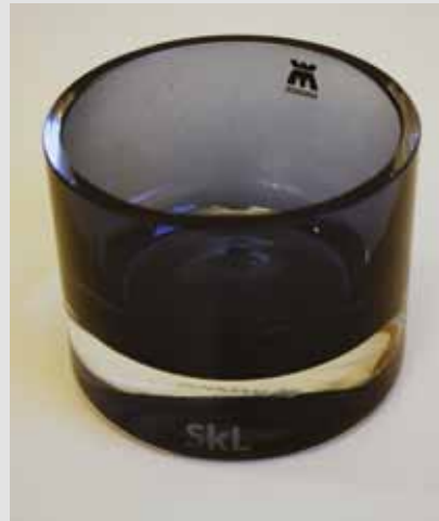
SkL lyslykt, kr 165,-