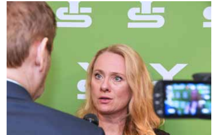
Arbeidsminister Anniken Hauglie pekte på at fagbevegelsen og organisasjonene vil bli mer nødvendig da hun gjestet YS-konferansen.