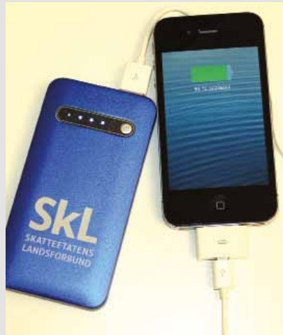
Lader med SkL-logo, kr 165,-