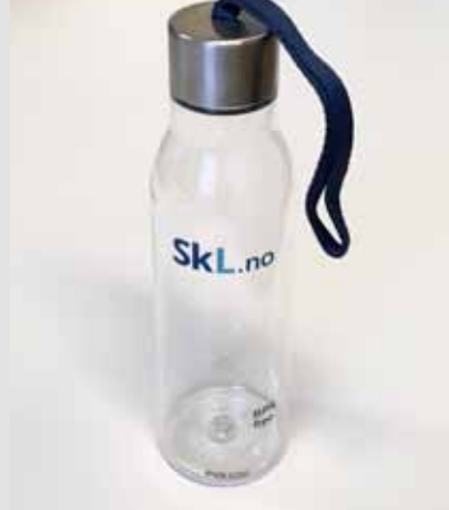
SkL drikkeflaske, kr 160,-