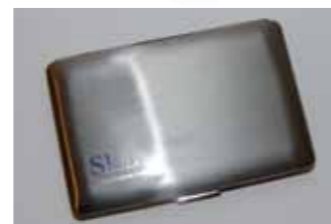
Kortholder kr. 55,-