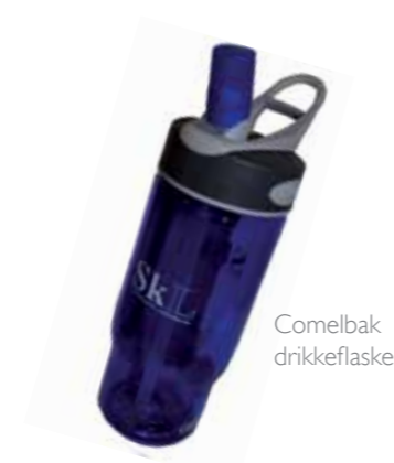
Comelbak drikkeflaske kr. 125,-