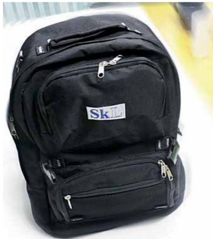
SKLs ryggsekk, kr. 150,-