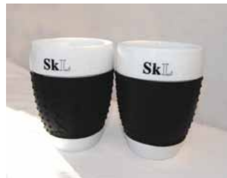
Bodum porselenskrus, 2 stk