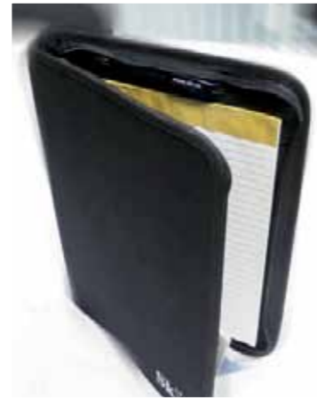
SKLs dokumentmappe, kr. 150,-