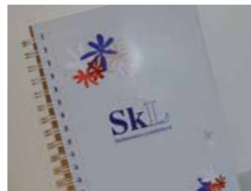
A5 skrivebok kr. 30,-