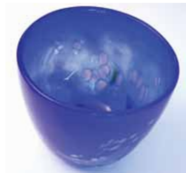
Liten bolle fra SKL kr 250,-