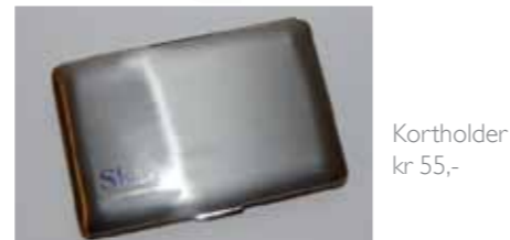
Kortholder kr 55,-