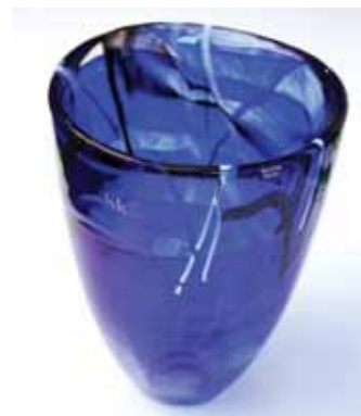
SKL-vase fra kr 365,-