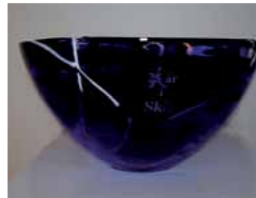
SKLs jubileumsbolle, kr 175,-