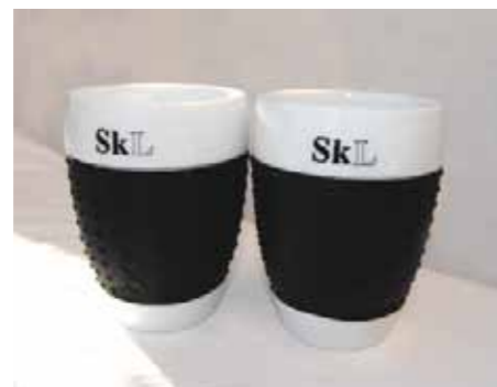
Bodum porselenskrus, 2 stk 135,-