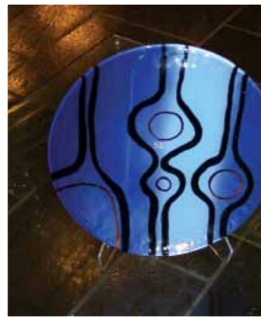
SKLs fat, kr 500,-