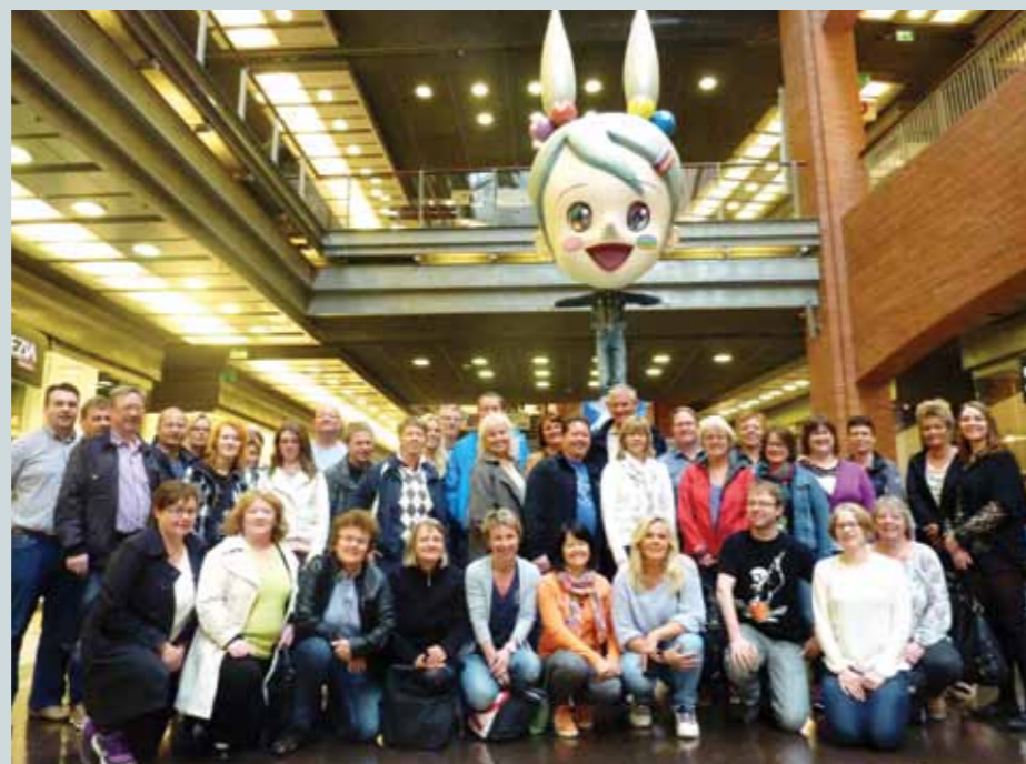
Her ser vi deltakerne samlet på et av Europas største og mest prisbelønte kjøpesentre, foran en av de lokale severdighetene.

Nesten 40 medlemmer i avdelingen var i slutten av mai samlet i Polens vugge, Poznan. Arbeidsrettslige temaer, arbeidsmiljø, lønn og omstilling var tema på konferansen.