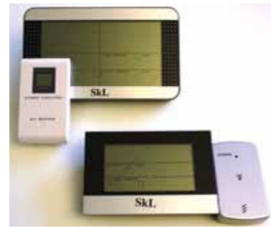
Stor værstasjon kr 200,- Liten værstasjon kr 180,-