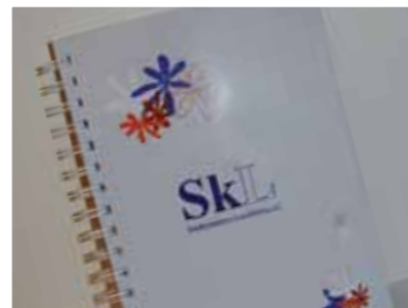
A5 skrivebok kr 30,-