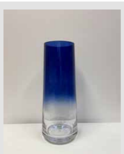
Høy SkL-vase, kr 250,-