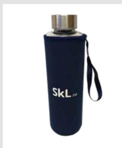
SkL drikkeflaske, kr 160,-