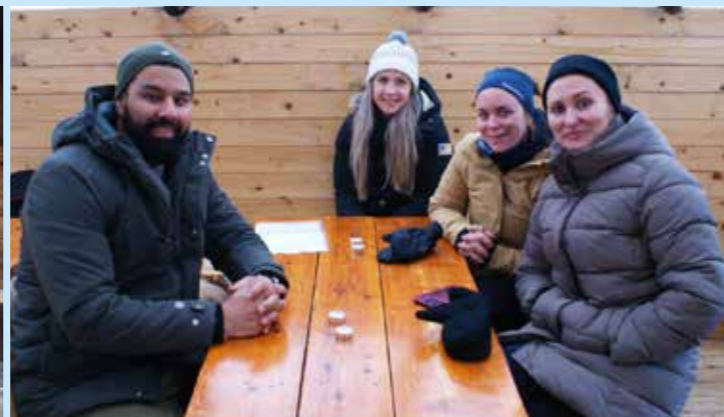
I tillegg til det faglige programmet ble det også tid til uteaktiviteter.

Deretter fulgte middag på hotellet. Etter middagen samlet vi oss i hotellbaren Naustet – en rustikk og tøff bar med biljardbord og stor plass. Jeg tok initiativ til en musikkquiz, hvor konkurransen var steinhard og nivået skyhøyt. Vinnerlaget fikk heder og ære.