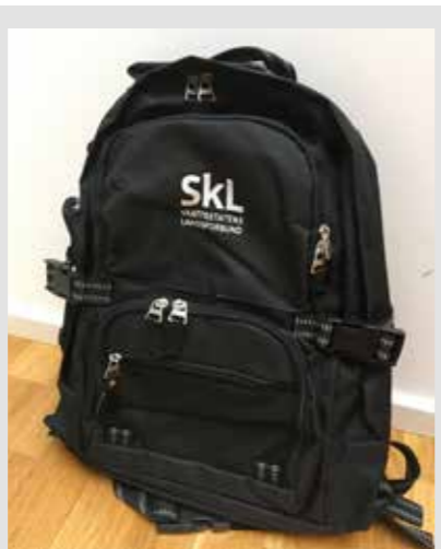
SkLs sekk, liten, kr 150,-