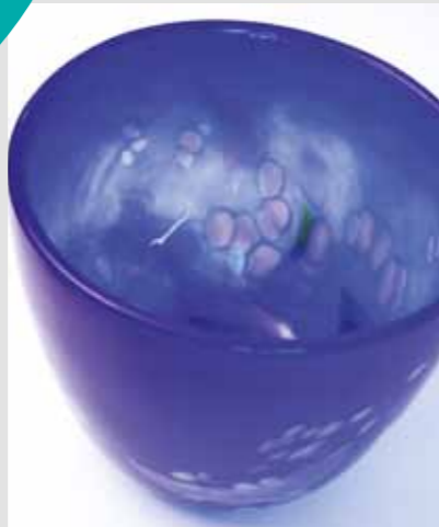
Liten bolle fra SkL, kr 250,-