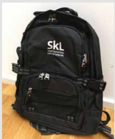
SkLs sekk, liten, kr 150,-