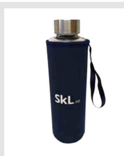
SkL drikkeflaske, kr 160,-