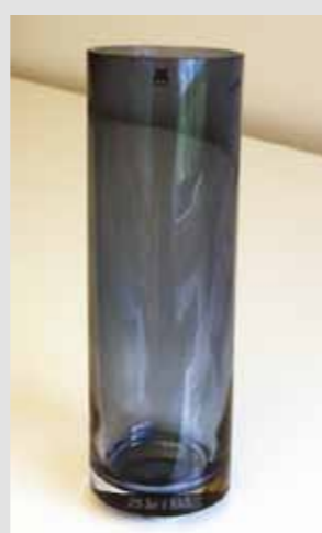
Høy SkL-vase, kr 350,-