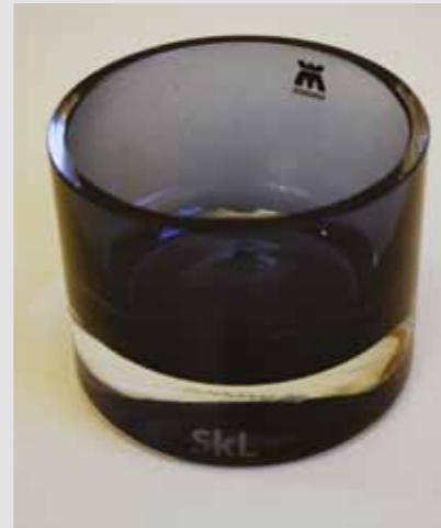
SkL lyslykt, kr 165,-