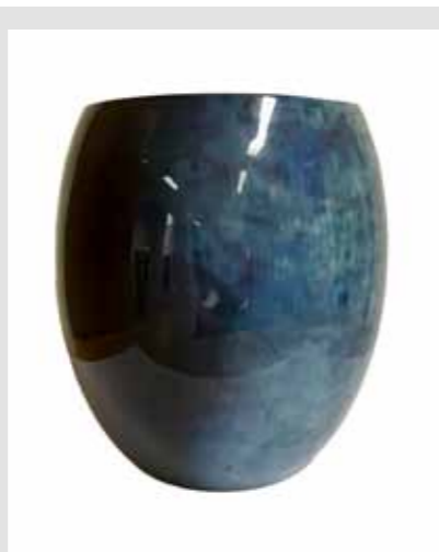
Stelton-vase, kr 899,-