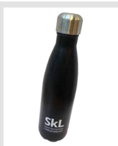
SkLs termoflaske, kr 115,-