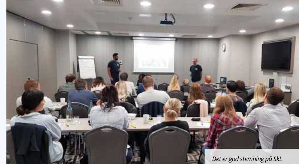
Det er god stemning på SkL Ung-konferansene, en god blanding av læring og sosialt samvær.