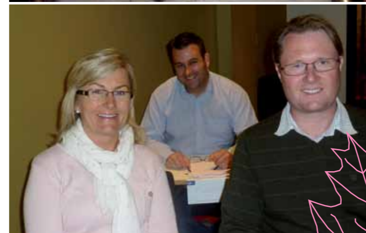
Bilde 1: Deltakere på Trinn 2.