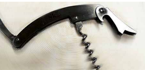
SkLs vinopptrekker, kr. 65,-