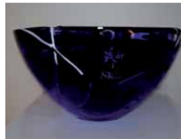
SkLs jubileumsbolle, kr. 175,-