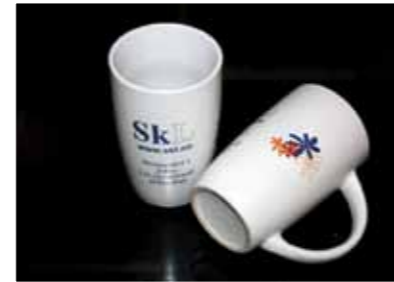
SkLs krus, kr. 25,-