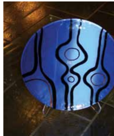
SkLs fat, kr. 500,-