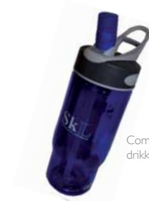
Comelbak drikkeflaske kr. 125,-