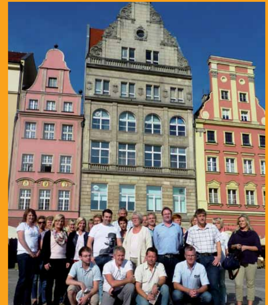
SkL SITS Grimstad på seminar i Wroclaw, Polen.