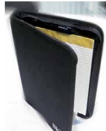
SkLs dokumentmappe, kr. 150,-