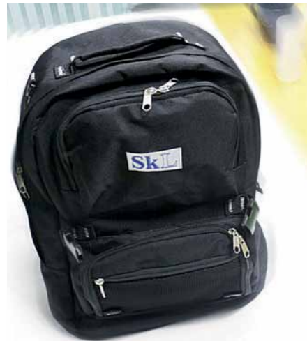
SkLs ryggsekk, kr. 150,-