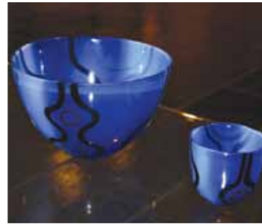
SkLs bolle, kr. 475,- SkLs lyslykt, 180,-