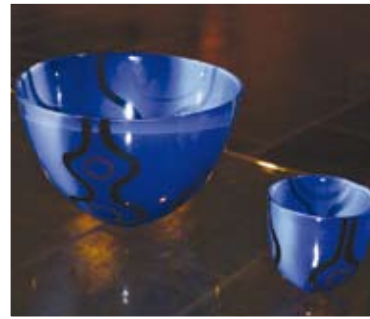
SKLs bolle, kr. 475,- SKLs lyslykt, 180,-