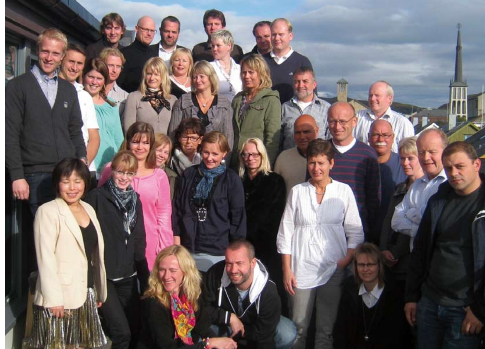
Det satses på e-handel. Her er "gjengen" samlet i Bodø i september 2010.