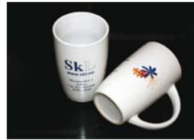
SKLs krus, kr. 25,-