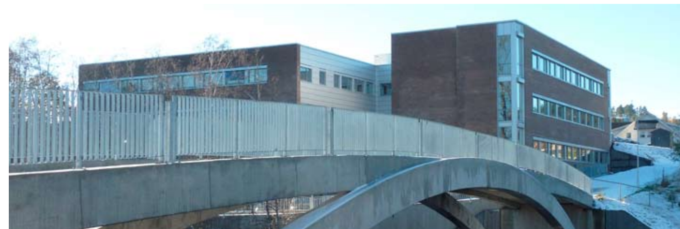
Fra baksiden av det flunkende nye bygget, noe mer idylliske omgivelser enn parkeringsplassen på framsiden.