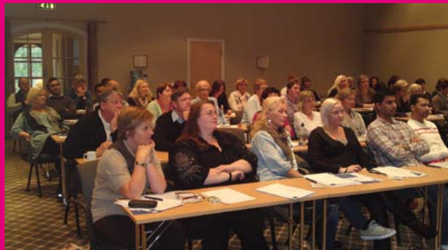
Høstkonferanse på Hafjell. Det ble både faglig og sosialt påfyll for medlemmene i SkL øst.