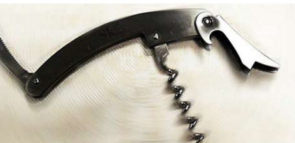
SKLs vinopptrekker, kr. 25,-