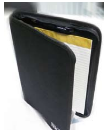
SKLs dokumentmappe, kr. 150,-