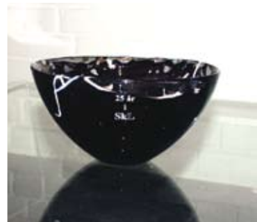
SKLs jubileumsbolle, kr. 175,-