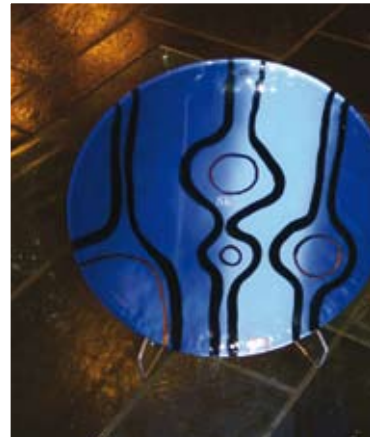
SKLs fat, kr. 500,-