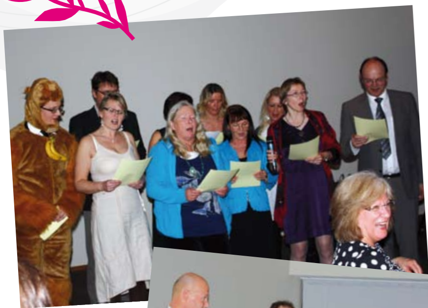
Her er styret i SkL og direktørene i fri utfoldelse under middagen.

Over 100 medlemmer fra sør var samlet til årsmøte og årskonferanse på Quality Spa & Resort Kragerø 16. og 17. mars. Det var stort engasjement blant deltakerne, ikke minst da regionledelsen var "fritt vilt" og svarte så godt de kunne på spørsmål fra salen.