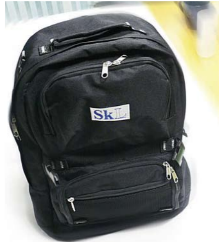
SKLs ryggsekk, kr: 150,-