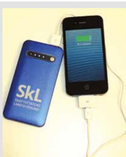
Lader med SKL-logo, kr 165,-