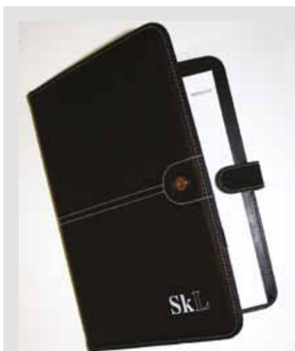
SkLs dokumentmappe, kr 150,-