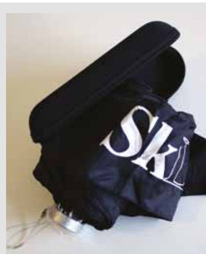
SkL-paraply i praktisk etui kr 100,-