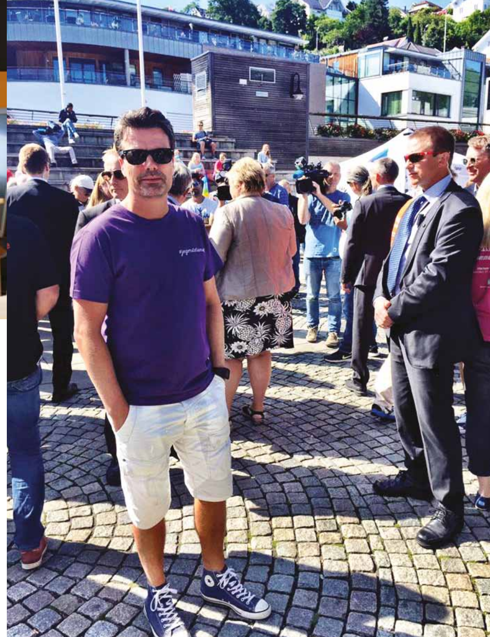
Selv om politisk påvirkning har vært på agendaen til NT lenge, har det vært spesielt viktig i forbindelse med Toll-Skatt, her fra Arendalsuka.