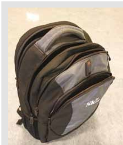
SkLs pc-sekk, kr 350,-