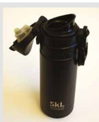
SkL-termos, kr 95,-