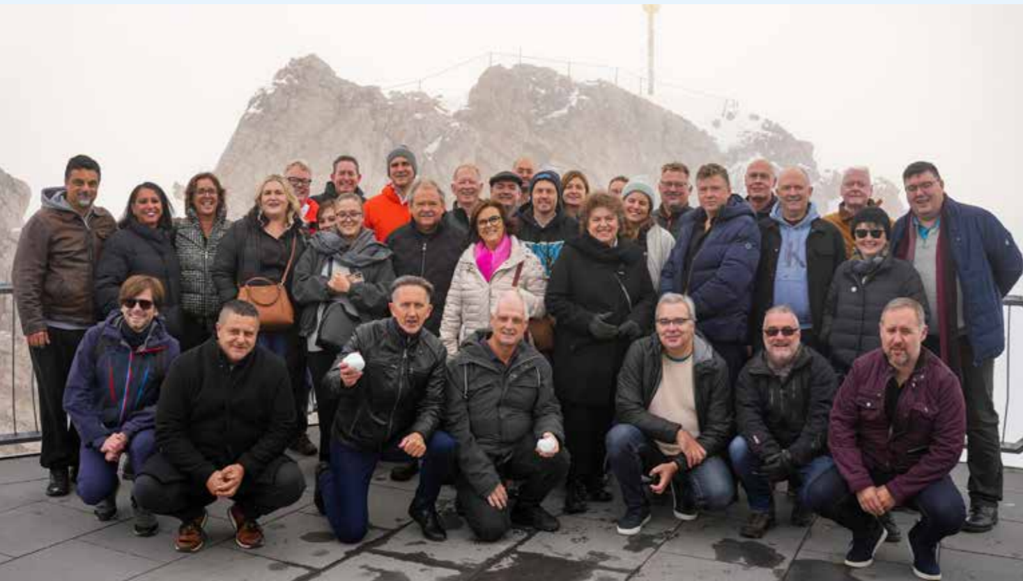
Her ser vi alle kongressdeltakerne på Tysklands høyeste fjell, Zugspitze.