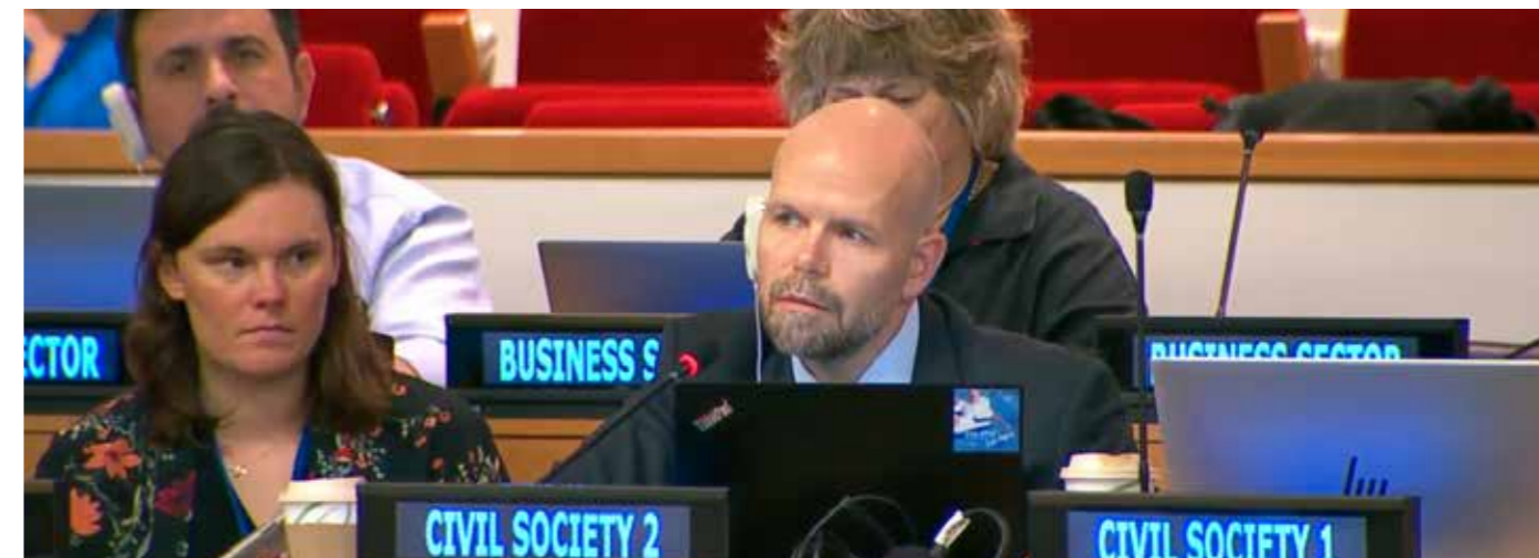
Fjeldskår holdt innlegg i forhandlingene om rammen for en skattekonvensjon i FN i starten av august.

Tax Justice Norge jobber for et rettferdig skattesystem, både nasjonalt og globalt.