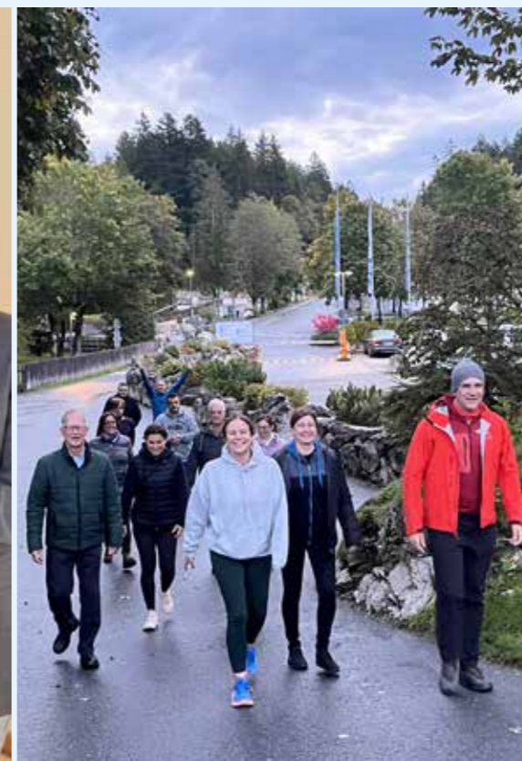
Morgentur kl. 07:00 i flott natur sto også på programmet for de som ønsket det.