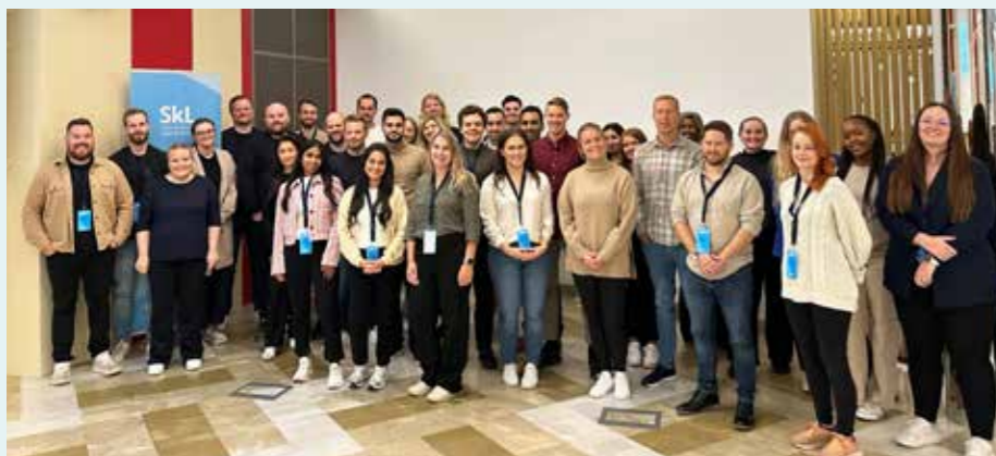
Alle deltakerne på årets SkL Ung-konferanse.