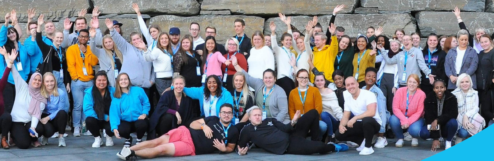
Delta Camp 2019.

Organisasjonsutviklingsprosjektet Delta 2020 representerte en omfattende gjennomgang av Delta som organisasjon og spant over et vidt spekter av oppgaver som «Hvem er Delta til for» til oppgaven «Utforme nytt kontingentsystem og fastsetting av økonomifordeling».