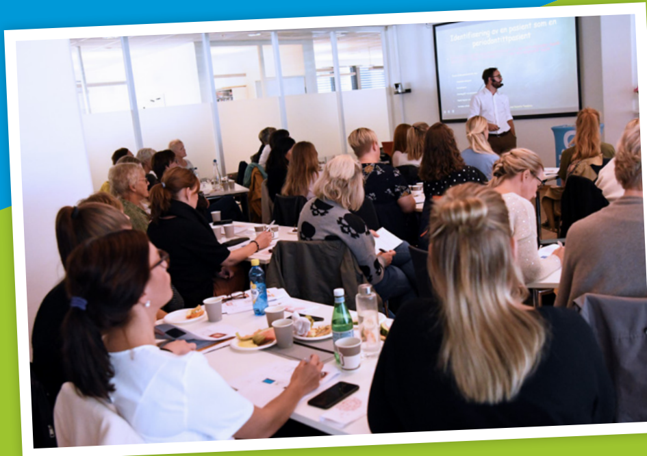
Medlemmer på kurs i Delta.

Det ble arbeidet med organisasjonsutviklingsprosessen under de regionale nettverkene. Forslag og modeller ble også sendt ut på høring til referansegruppen før endelig vedtak av representantskapet 2019.