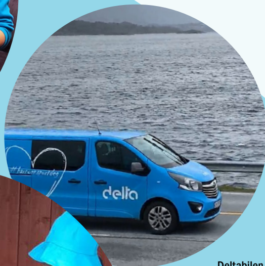
Deltabilen på Atlantehavsveien